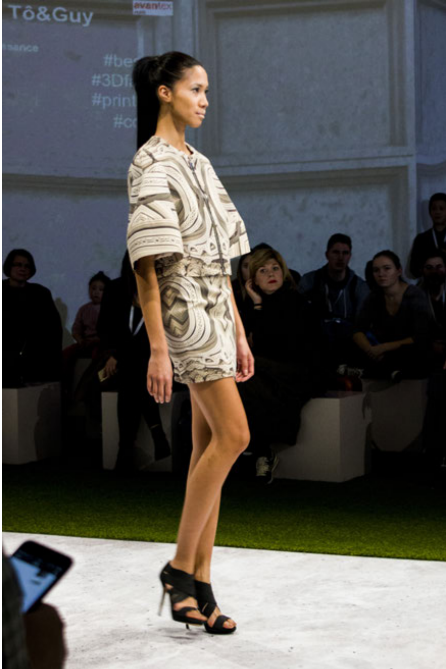
Défilé au salon AVANTEX Paris Collection Renaissance - Tô&GUY

Lors de l'achat de la Monna Lisa par eMODE en 2011, trois variables sont entrées en considération : « Le dimensionnement était un élément clé pour nous. Il s'agit d'une machine industrielle mais de taille raisonnable. Et bien évidemment, en plus de la qualité des impressions qui correspond à nos exigences et à celles des designers, le coût de l'imprimante était aussi un critère clé ». Depuis, ce sont de nombreux étudiants, créateurs, porteurs de projets, entreprises qui comme Tô&Guy ont pu profiter de l'expertise et du réseau de la plateforme eMODE ainsi que des possibilités de création offertes par la technologie de la Monna Lisa d'Epson Robustelli.