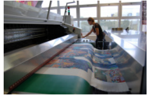
Workshop Licence professionnelle des Métiers de la Mode de l'Université d'Angers