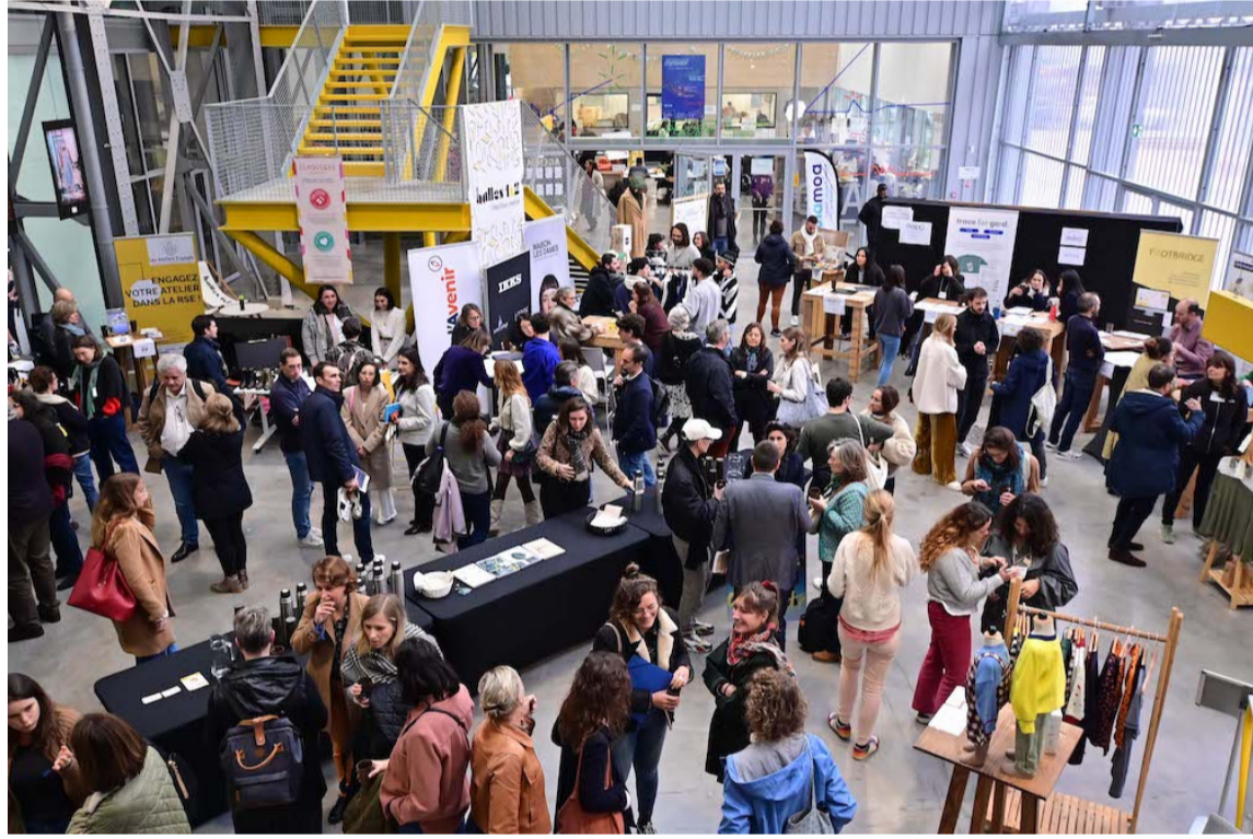
Les Fashion Green Days ont fait le plein à Nantes ces 16-17 novembre 2023.